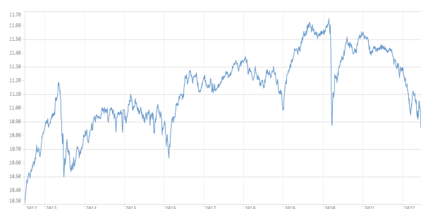
摩根總收益組合證券投資信託基金 月配息型新臺幣計價類別